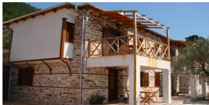
Alexis New Villas