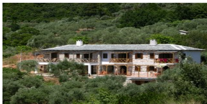
Alexis New Villas