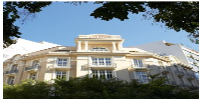
Das Hotel The Excelsior