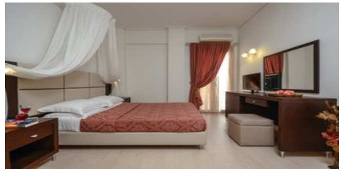
Wohnbeispiel Superior Zimmer