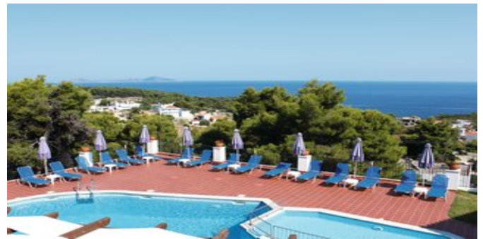
Blick über den Pool auf das Meer