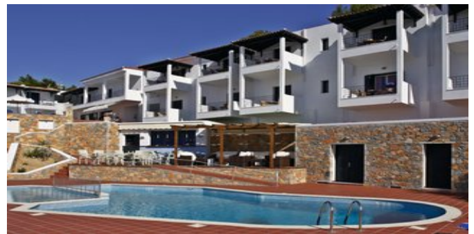
Das Hotel Atrium