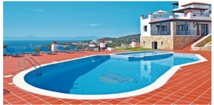
Ein Teil der Anlage mit Pool

ATTIKA SERVICE Telefonische Betreuung durch deutschsprachige Reiseleitung. Fähr-/Landtransfer bei Pauschalreise inklusive.