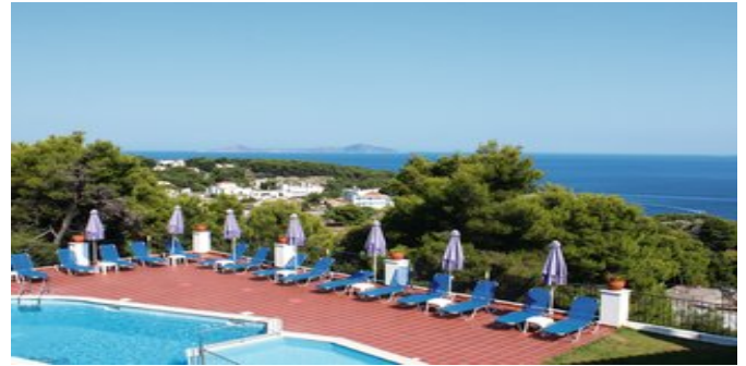
Blick über den Pool