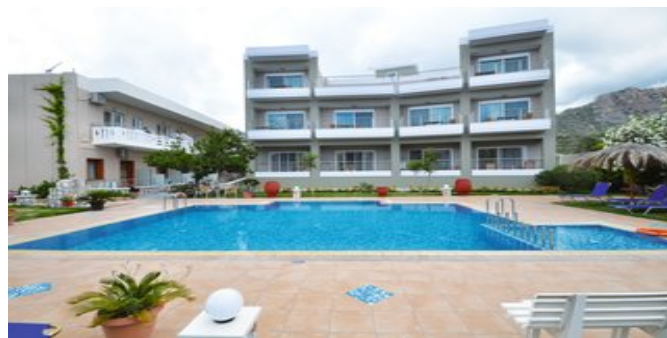
Die Anlage mit Pool

PREMIUM ZIMMER (SC) Ca. 20-28 qm. Für 2-3 Personen. Lage in Relax III. Mit Klimaanlage (gegen Gebühr), W-LAN Internetzugang, TV, Kühlschrank, Safe. Fliegengitter, Dusche/WC, Föhn. Balkon oder Terrasse mit Pool-/ Bergblick.