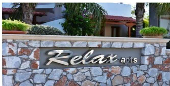
Relax Apartments & Studios