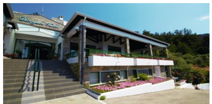
Das Hotel Dionysos