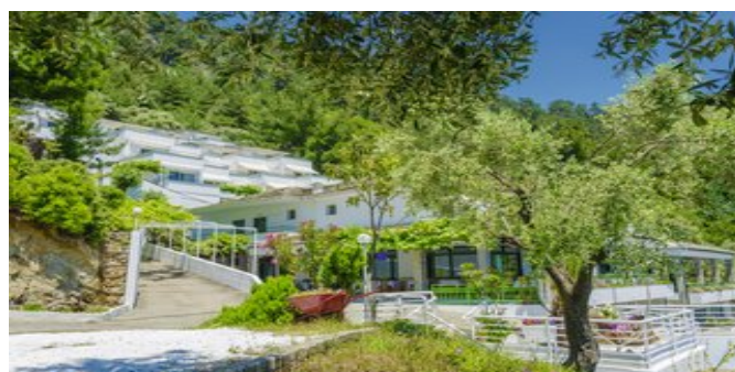
Das Hotel Dionysos