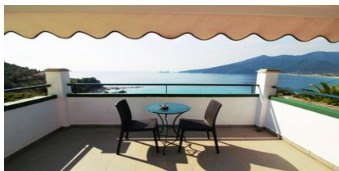
Auf dem Balkon