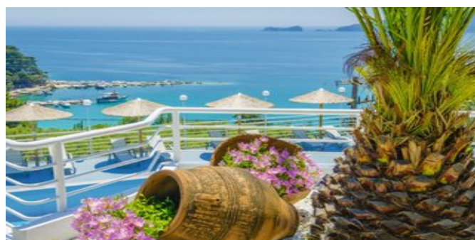
Blick auf den Pool und das Meer