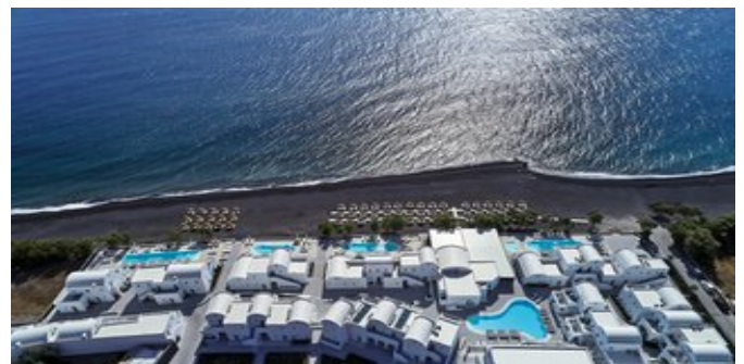
Blick auf das Costa Grand Resort & Spa Hotel