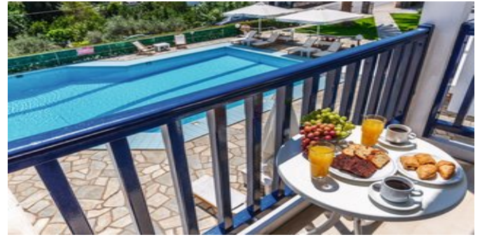
Auf dem Balkon