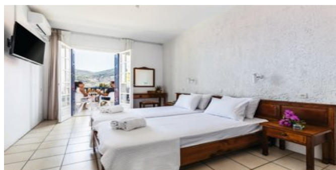
Wohnbeispiel Zimmer seitlicher Meerblick