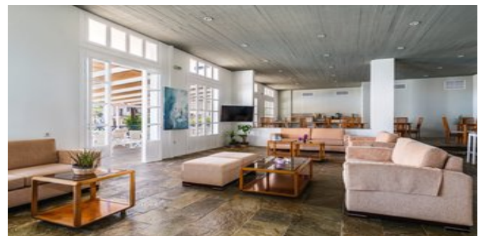
In der Lobby