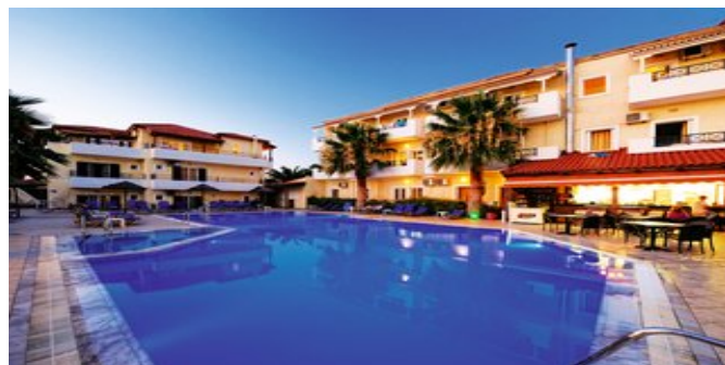
Das Hotel Philoxenia mit Pool

POOLBEREICH Süßwasserpool mit kleinem, separaten Kinderbecken und Hydromassage.