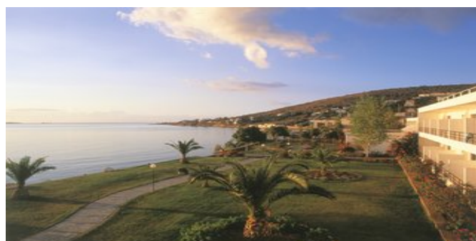
Das Hotel Golden Sand an der Karfás-Bucht