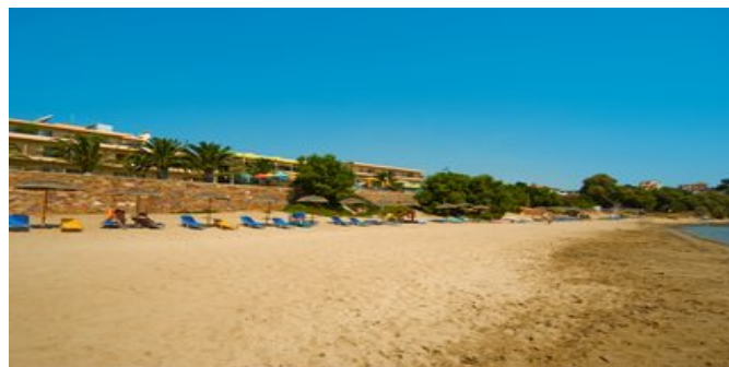
Das Hotel Golden Sand