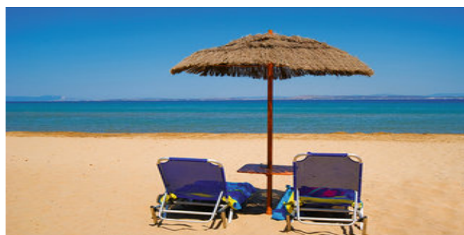
Der Strand beim Hotel