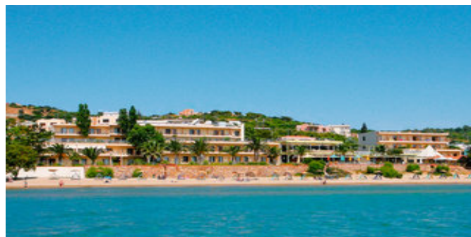
Das Hotel Golden Sand

HOTELCHARAKTER Als beliebter Treffpunkt der einheimischen Bevölkerung werden im Haus auch gerne griechische Gesellschaften, z.B. Hochzeiten, abgehalten.