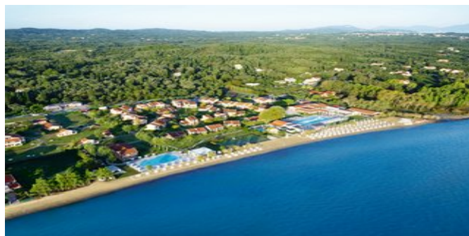
Blick auf das Mayor Capo di Corfu

POOLBEREICH 2 Süßwasserpools (davon 1 Aktivitätspool und 1 Ruhepool) mit