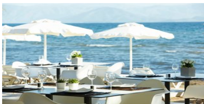
Auf der Restaurantterrasse