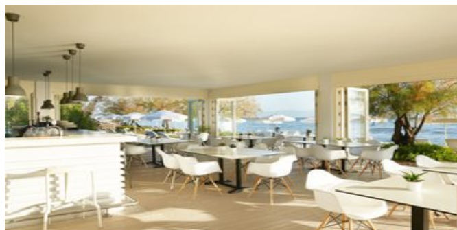
Eines der Restaurants