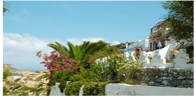
Die Studios Sunset

HAUSCHARAKTER Das freundliche Besitzerpaar führt am Ortseingang die urgemütliche Taverne "Small Paradise" mit ausgezeichnete Küche. Die Besitzerin Irini kocht selbst und bietet ein