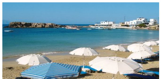
Strand von Lefkós