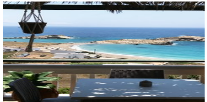
Blick von der Anlage