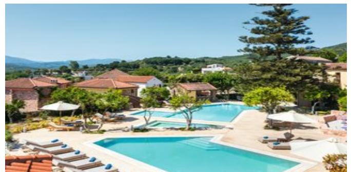
Blick auf den Poolbereich