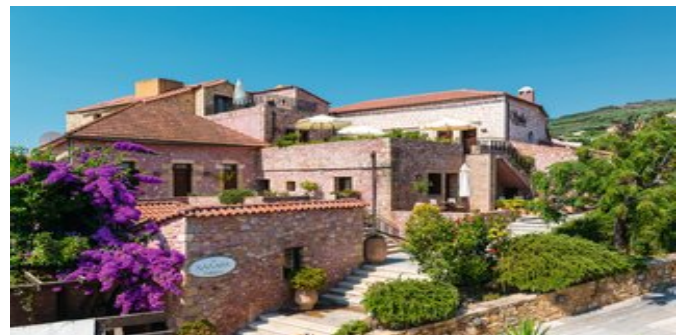
Das Hotel Spilia Village