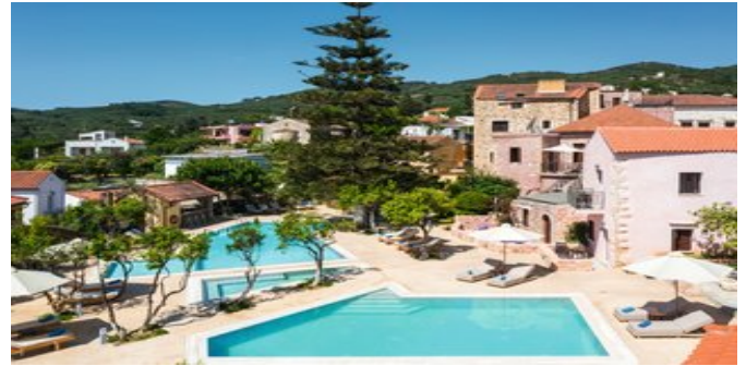
Die Anlage mit Pool

SUPERIORZIMMER (RB) Grundausrüstung wie die Zimmer, jedoch geräumiger, mit Schlafcouch für eine 3. Person. Bad oder Dusche/WC, Föhn. Balkon oder Terrasse (teils Gemeinschaftsterrasse).