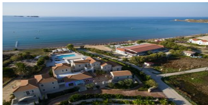
Blick auf die Anlage Costa Rosa

VERPFLEGUNG HP (reichhaltiges Frühstücksbuffet und Abendessen à la carte mit