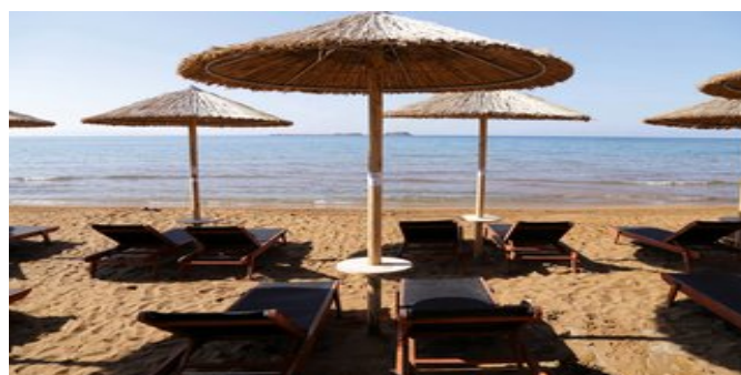
Der Strand bei der Anlage