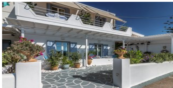
Das Hotel Villa Zampeta