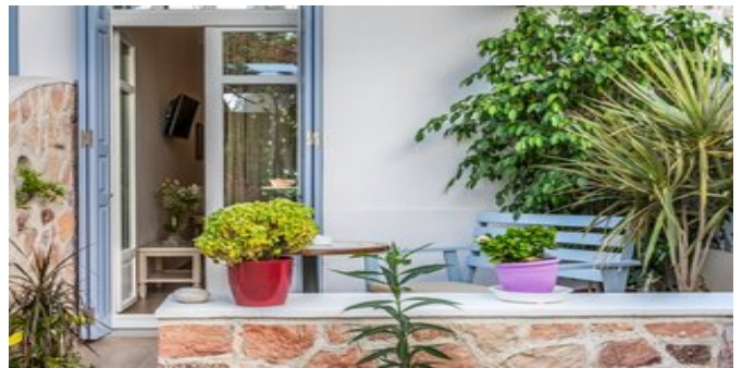
Auf der Terrasse