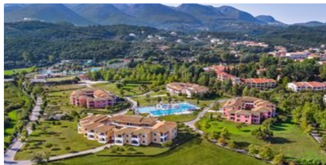
Blick über die Anlage

FAMILIEN APPARTEMENTS (AA/AB) Für 2-4 Personen. Ca. 56 qm. Grundausstattung wie die Botanica Zimmer. 2 Schlafzimmer, durch eine Schiebetür getrennt, eines mit Queensize-Bett, eines mit 2 Einzelbetten. Beide Zimmer mit Zugang zum gemeinsamen Bad/WC, Föhn. Mit Balkon und Gartenblick (= AA) oder mit Terrasse,