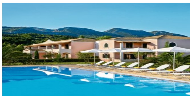
Das Costa Botanica Grecotel