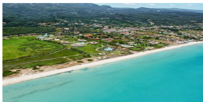
Blick auf den Strand