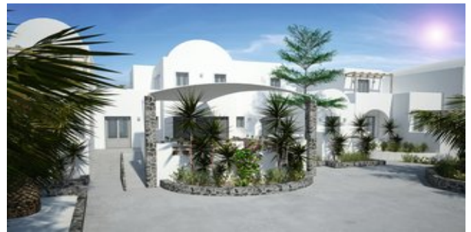
Das Strogili Hotel (Modellskizze)