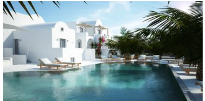
Der Poolbereich (Modellskizze)

SPARTIPP Bei Buchung eines Attika Mietwagens ab/bis Flughafen Transfergutschrift EUR 38 pro Person. Einen Mietwagen der Kat. A1 erhalten Sie schon ab EUR 140 pro Woche.