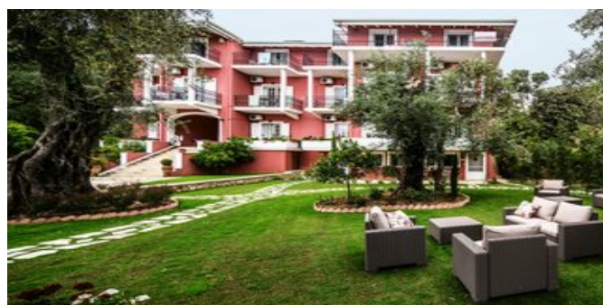
In der Anlage