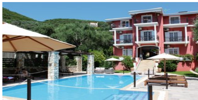
Das Vassilis Guest House

APPARTEMENTS A (AA) Ca. 80 qm. Für 2-4 Personen. Lage im Obergeschoss. Sehr gepflegt. Grundausstattung wie die Superiorzimmer, zusätzlich mit Fliegengitter an der Balkontür. Wohn-/Schlafraum mit Couch und Küchenzeile (für die Zubereitung von Kleinigkeiten). 2 separate