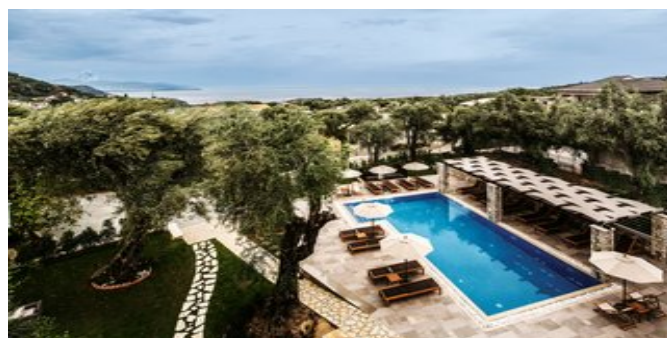
Blick über den Pool zum Meer