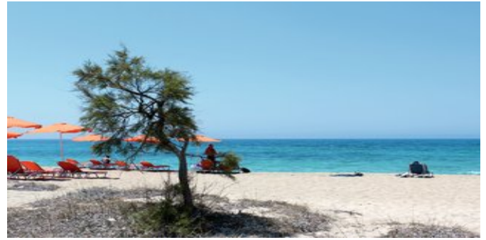
Der Strand von Aghios Prokōpios