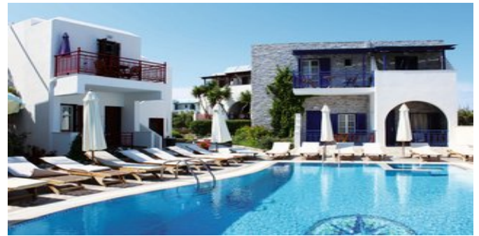
Die Hotel-Appartements Katerina mit Pool

ATTIKA SERVICE Deutschsprachige Reiseleitung. Fähr-/Landtransfer bei Pauschalreise inklusive.