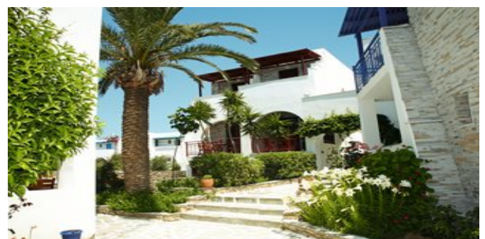
Die Anlage Katherina