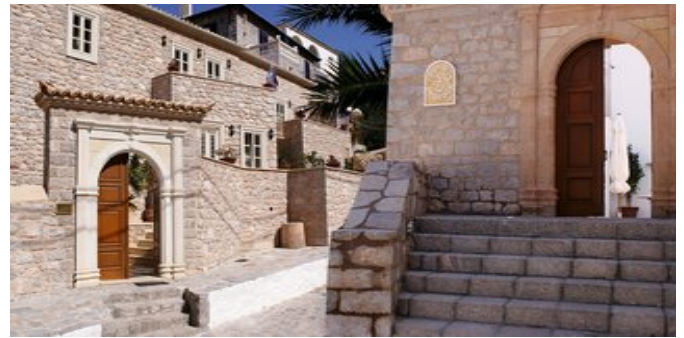
Das Angelica VIP Hotel