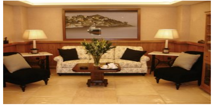
In der Lounge