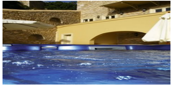
Der Mini Pool