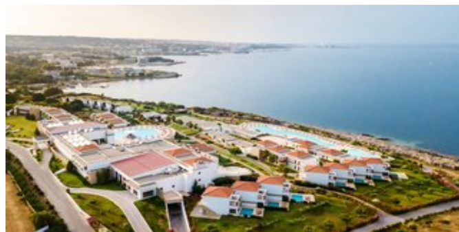
Blick auf The Kresten Royal Villas & Spa

JUNIORSUITEN OPEN PLAN (UA) Ca. 45 qm. Für 2-3 Erwachsene oder 2 Erwachsene und 2 Kinder. Grundausrüstung wie die Zimmer, jedoch geräumiger, zusätzlich Sitzecke mit Doppelschlafcouch. Elegantes Bad/WC mit Jacuzziwanne, Föhn, Bademantel, Slipper. Balkon oder Terrasse mit Meerblick.