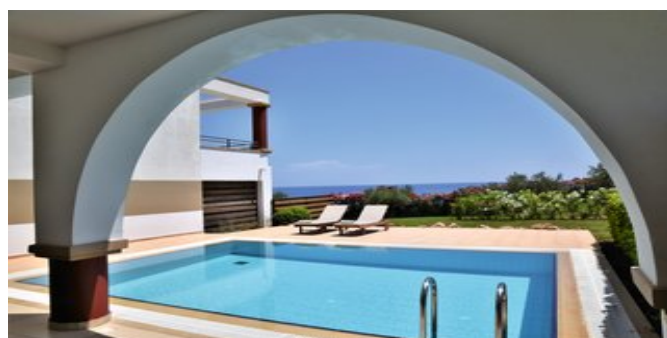
Wohnbeispiel Royal Suite Villa mit privatem Pool