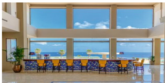
An der Bar