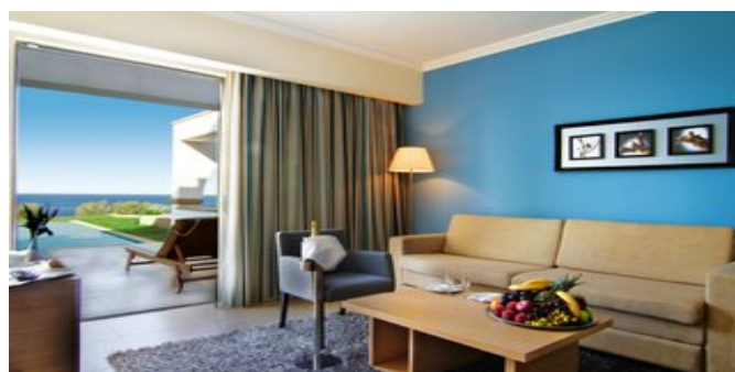
Wohnbeispiel Villa Juniorsuiten mit privatem Pool