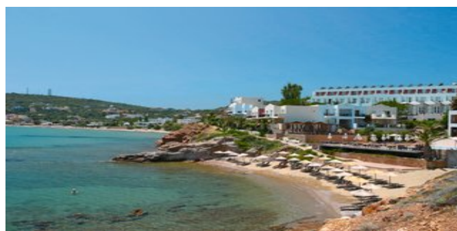
Das Erytha Hotel & Resort am Strand