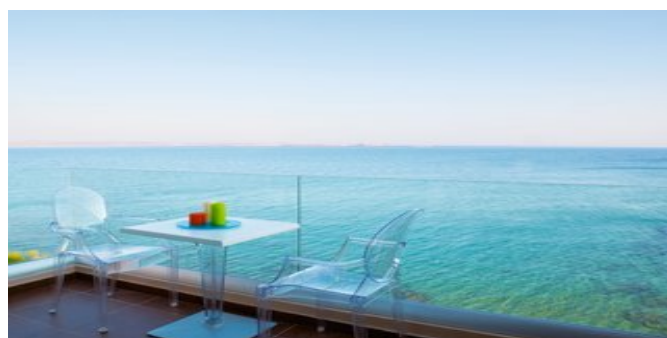
Den Ausblick genießen