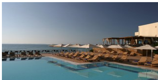
Das Erytha Hotel & Resort mit Pool