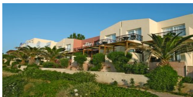
Das Erytha Hotel &amp; Resort