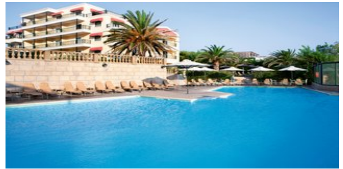
Das Ramada Attica Riviera

PREMIUM SUITEN (UA) Ca. 37 qm. Für 2-3 Erwachsene und 1 Kind. Grundausstattung wie die Superior Zimmer. Wohn-/Schlafbereich mit Schlafsofa. Ein separates Schlafzimmer. Bad oder Dusche/WC, Föhn und Markenpflegeprodukte. Balkon mit seitlichem Meerblick.