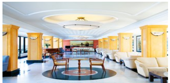
Im Ramada Attica Riviera