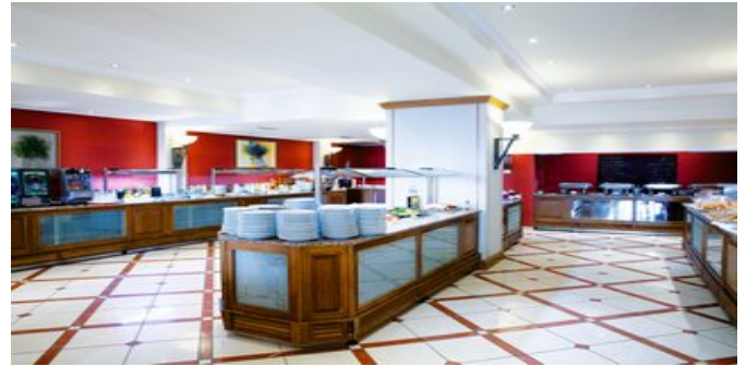
Im Restaurant "Ambrosia"