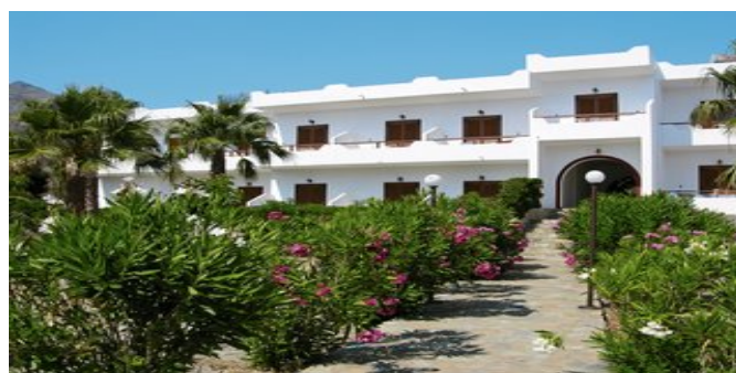
Die Studios Stavris