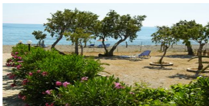
Der Garten mit Strand