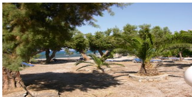
Der Garten mit Strand