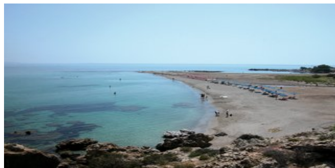
Der Strand von Frangokastello