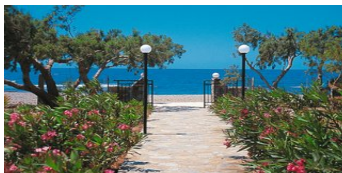
Der Gartenweg zum Strand