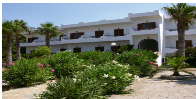
Die Studios Stavris