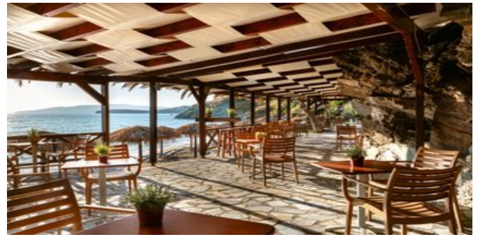
Die Snackbar am Strand