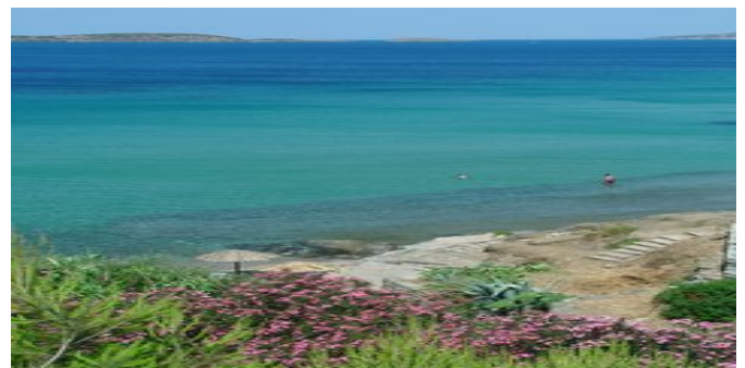
Blick auf das Meer