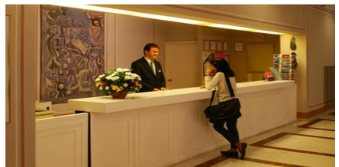
An der Rezeption