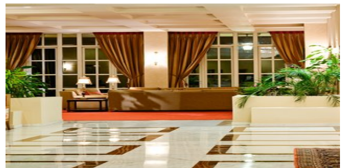
In der Lobby