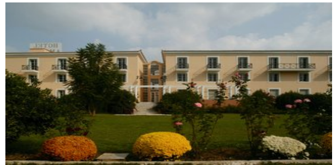
Das Hotel Amalia Nauplia