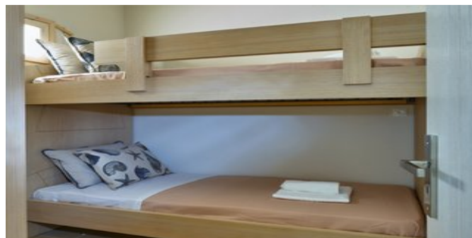
Wohnbeispiel Apartments 52qm