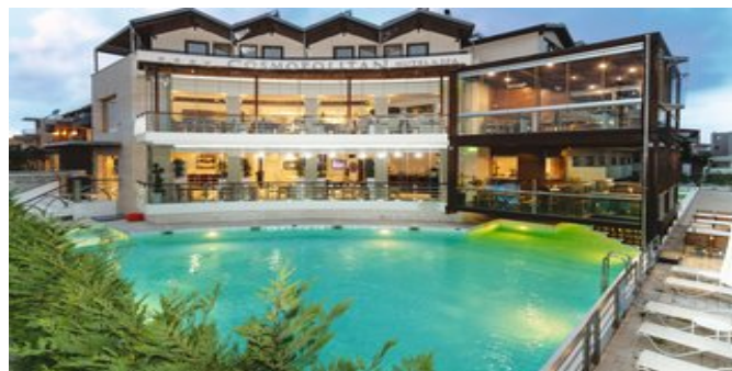
Das Cosmopolitan Hotel & Spa

STRAND Langer, flach abfallender Sandstrand