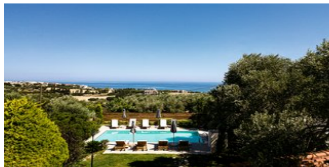
Blick auf den Pool