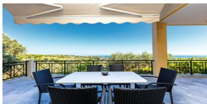
Blick von der Terrasse