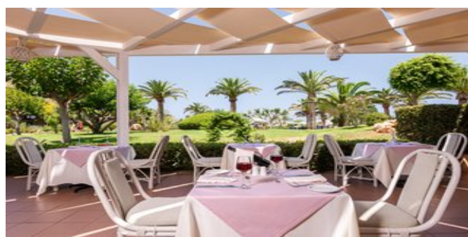
Die Terrasse des Restaurants