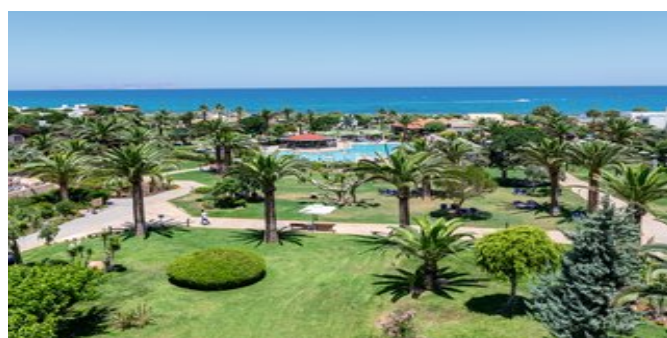
Blick auf den Garten