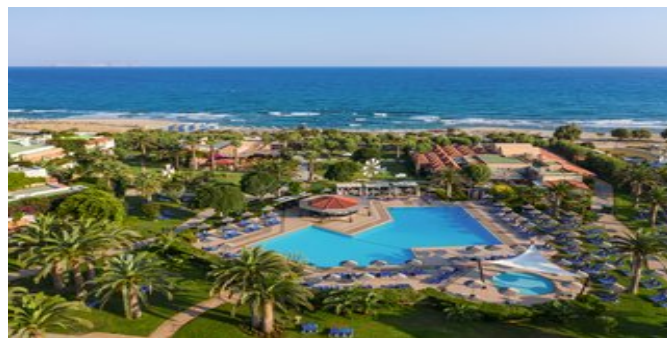
Blick auf die Anlage und das Meer

SUPERIOR FAMILIENZIMMER (FA/FB) Ca. 34-36qm. Für 2-4 Personen. Grundausrüstung wie die Zimmer, jedoch mit einem zusätzlichen Wohn-/Schlafraum mit 2 ausklappbaren Schlafsesseln und Minibar (tägliche Auffüllung). Bad oder Dusche/WC, Föhn, Bademantel, Slipper.