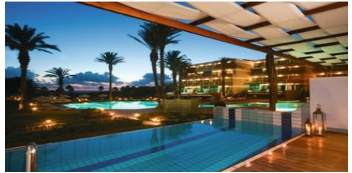
Die Anlage mit Blick auf den Pool