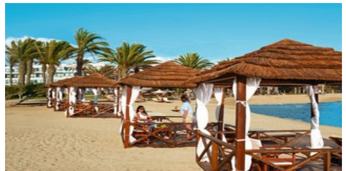
Der Strand bei der Anlage mit Cabanas