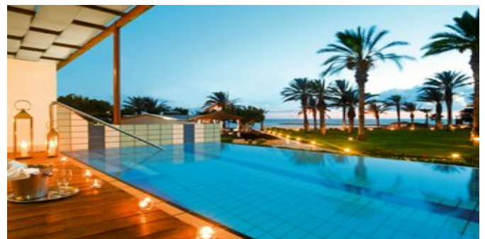
Wohnbeispiel Executive Suite