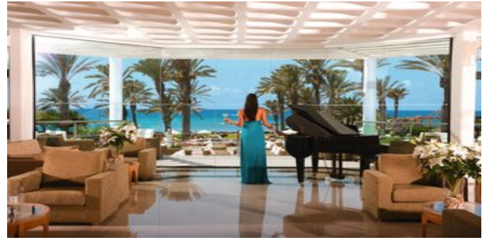
In der Lobby

VERPFLEGUNG ÜF, HP, VP, AI+ (sehr reichhaltiges Frühstücksbuffet, Abendessen in Buffetform mit wechselnden Themen oder wahlweise table d'hotel mit Reservierung oder à-la-carte 4-Gang Menü bei Voranmeldung und Verfügbarkeit. (Wahlweise Mittag- oder Abendessen). Dresscode: Beim Abendessen leger-