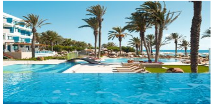
Der Poolbereich der Anlage

SUITEN (UB/UF/UC) Ca. 38 qm. Für 2-3 Personen. Wohnraum mit Sitzecke, Schlafcouch für die 3. Person und separater Schlafraum mit zusätzlichem LCD-Flachbildschirm. Grundausstattung wie die Junior Suiten. Marmorbad/WC mit zusätzlicher, separater Regendusche, zwei Waschbecken, Föhn, luxuriöse Pflegeprodukte, Strand- und Poolbadetücher, Waage, Kosmetikspiegel, Bademantel und Slipper. Balkon mit Blick zur Landseite (= UB), limitiertem Meerblick (= UF) oder mit frontalem Meerblick (=