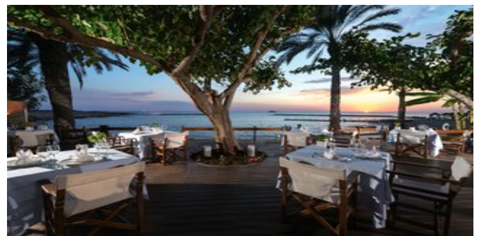
Das à-la-carte Restaurant "Kymata"