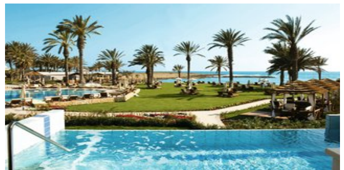
Wohnbeispiel Executive Suite mit privatem Pool