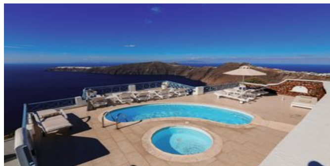
Blick auf den Poolbereich