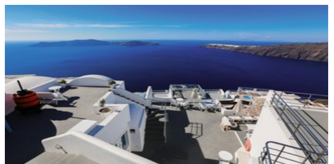
Blick auf die Anlage und das Meer