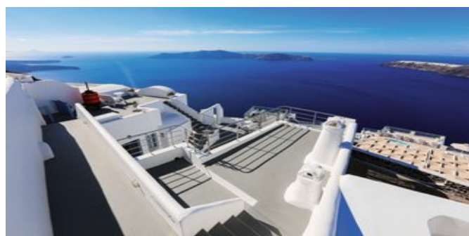
Blick auf die Anlage und das Meer