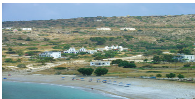
Blick auf den Strand von Lefkós