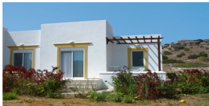
Die Dream Villas