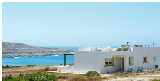
Blick über die Anlage