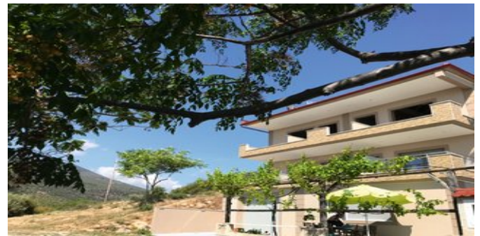
Aphrodite of Thassos