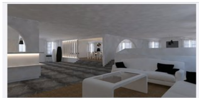
In der Lobby (Modellskizze)