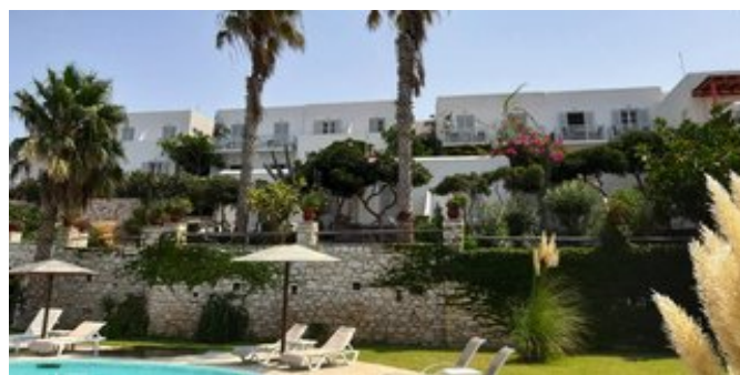
Das Hotel High Mill (Modellskizze)