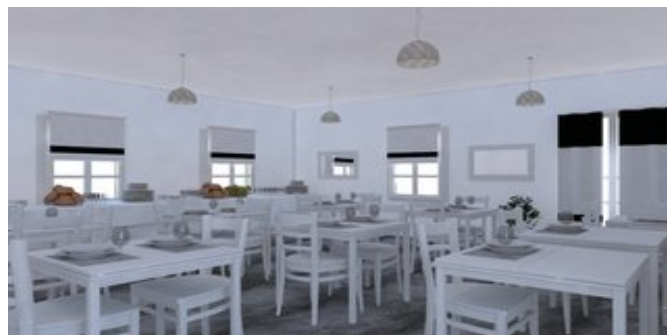
Das Restaurant (Modellskizze)