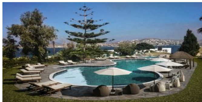
Der Poolbereich (Modellskizze)

ATTIKA SERVICE Fähr-/Landtransfer bei Pauschalreise inklusive.