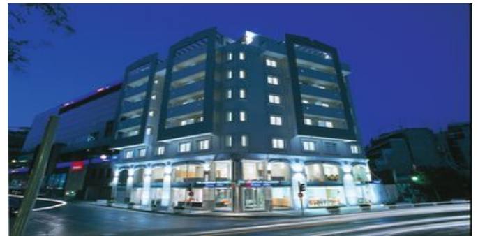
Das Athenian Callirhoe