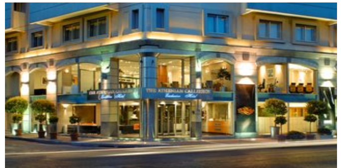
Das Hotel The Athenian Callirhoe