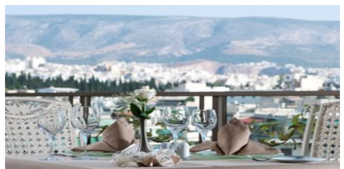
Im Restaurant auf der Dachterrasse