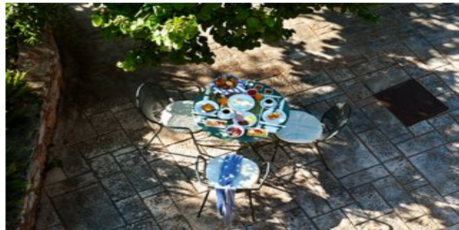
Garten mit Sitzecke

Website: www.attika.de E-Mail: verkauf@attika.de