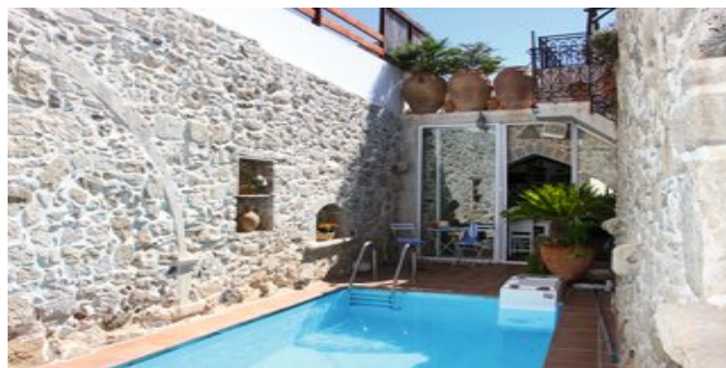
Villa Epimenidis - der Poolbereich

VILLA EPIMENIDIS (VB) Für 2-6 Personen. 2018 renoviert. Grundausrüstung wie bei Villa Radamanthis, mit Wohnraum, offener Küche und 2 Schlafzimmern mit je 3 Betten (je ein Doppel- und ein Einzelbett). Internetzugang. Der ca. 21 qm große Pool (wetterbedingt gefüllt) ist von Mauern umgeben und vom Wohnbereich aus über die Terrasse zugänglich. Über eine Außentreppe erreicht man die 2 leicht versetzten Dachterrassen, beide mit Sitzgelegenheiten, Liegen, Auflagen und Sonnenschirm. Von der oberen Terrasse reicht der Blick bis zum Meer. Bad mit Dusche/WC mit Hydromassage, Föhn und