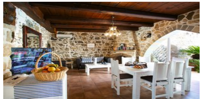
Wohnraum Villa Epimenidis - der Wohnraum