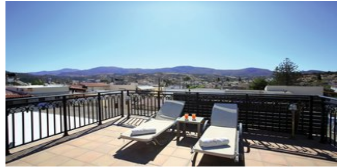
Villa Epimenidis - auf der Terrasse

ATTIKA SERVICE Deutschsprachige Reiseleitung. Taxi-Transfer bei Pauschalreise inklusive.