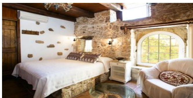
Villa Epimenidis - eines der Schlafzimmer