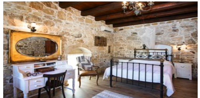
Wohnbeispiel Villa Epimenidis