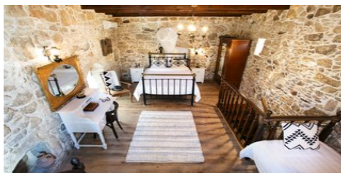
Wohnbeispiel Villa Epimenidis