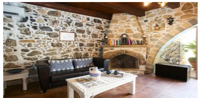
Villa Epimenidis - der Wohnraum