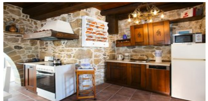
Villa Epimenidis - der Essbereich