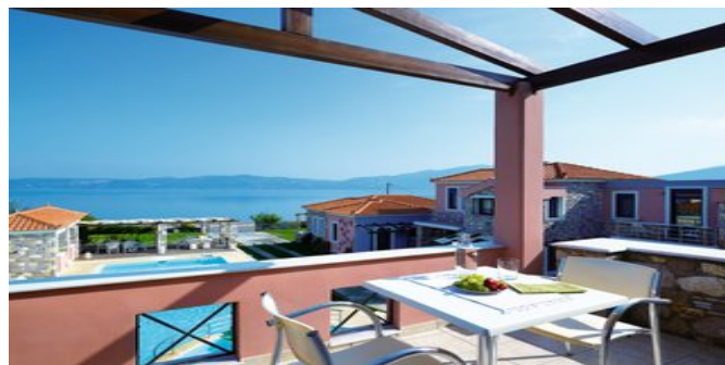
Blick von der Anlage

POOLBEREICH 1 Süßwasserpool und 1 Kinderbecken. Liegen, Auflagen und Sonnenschirme. Pool-/Snackbar mit Sitzbereich, in dem das Frühstück eingenommen wird.