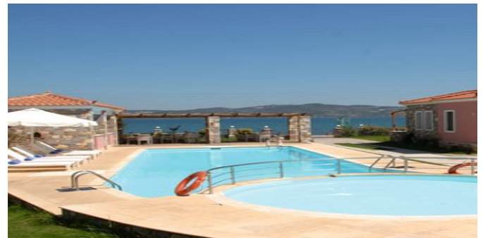
Blick auf den Pool