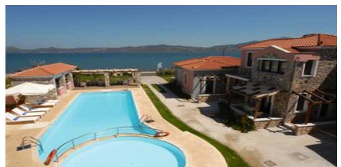
Die Anlage Aeolis