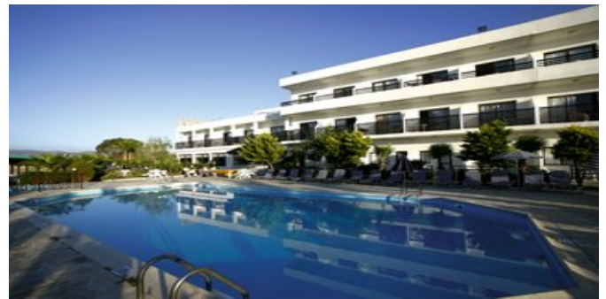
Außenansicht der Hotelanlage