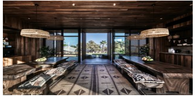
Der Kids Club

AKTIVITÄTEN / SPORT Gegen Gebühr: Outdoor-Fitnessbereich mit Pavillon. Bootsausflüge. Fahrradverleih. Wassersportmöglichkeiten am