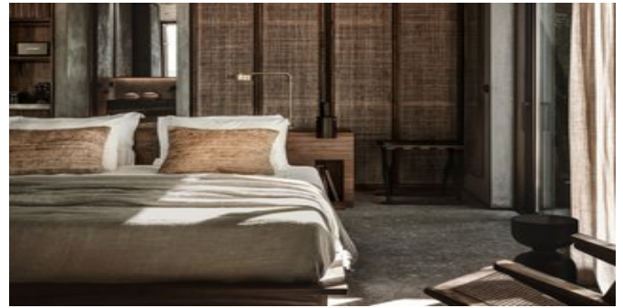
Wohnbeispiel Sapphire Bungalows