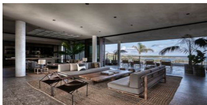
In der Lobby