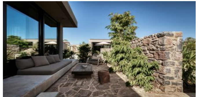
Wohnbeispiel Tropical Bungalows