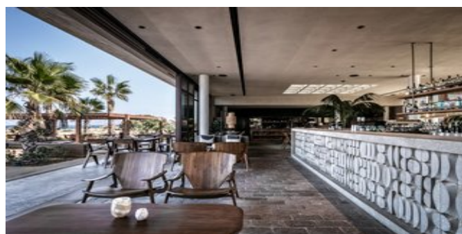
Das "Beach House"