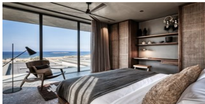
Wohnbeispiel Familien Villen

SAPPHIRE BUNGALOWS (BB) Ca. 30 qm. Grundausstattung wie die Tropical Bungalows. Dusche/WC, Föhn, Pflegeprodukte, Bademantel, Slipper. Balkon oder Terrasse mit Meerblick.