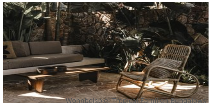
Wohnbeispiel Tropical Familien Bungalows