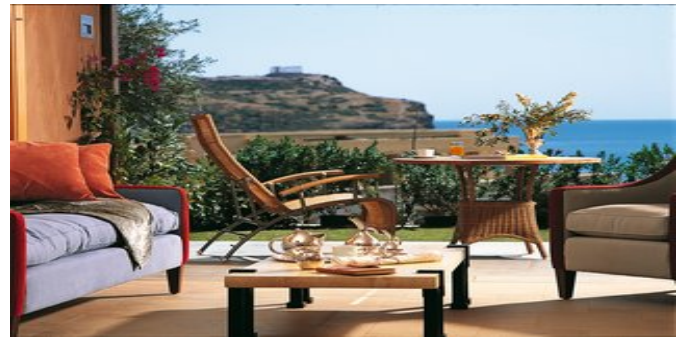
Auf der Terrasse