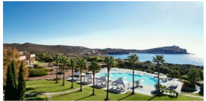
Blick über einen Teil der Anlage

DELUXE BUNGALOWS (BC) Ca. 36 qm. Einrichtung und Grundausrüstung wie die Superiorbungalows, jedoch etwas größer. Bad "en suite"/WC, Föhn, Bademantel, Slipper. Balkon oder Terrasse mit Meerblick oder Blick auf den Poseidontempel.