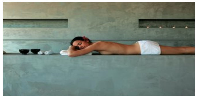
Entspannung im Wellness Bereich