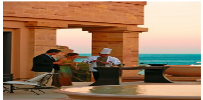
Auf der Terrasse