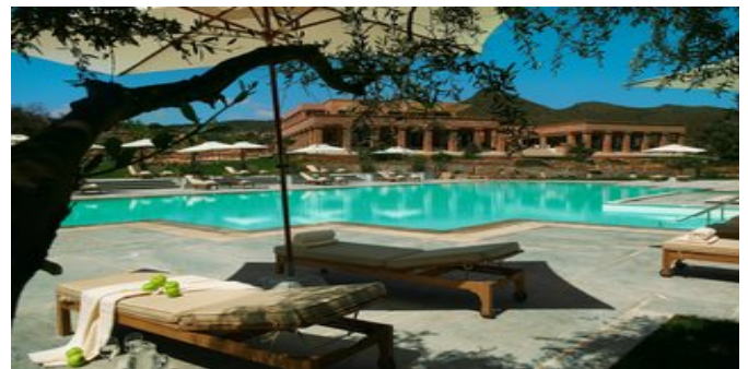
Hotel mit Poolbereich