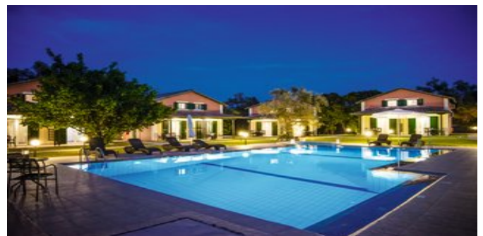
Außenansicht bei Nacht