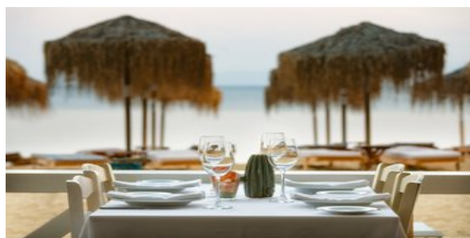
Im Pr. Ammos Restaurant