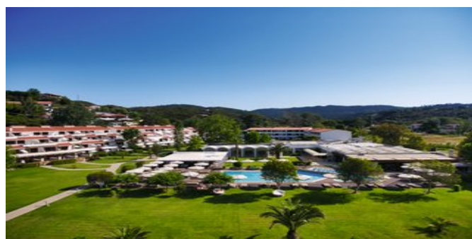
Blick auf die Anlage