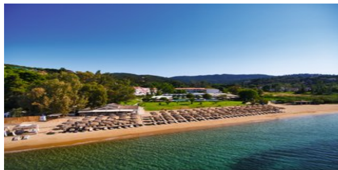
Blick auf die Anlage

SPARTIPP Bei Buchung eines Attika Mietwagens Transfergutschrift ab/bis Flughafen EUR 38, ab/bis Hafen EUR 36 pro Person. Einen Mietwagen der Kat. A1 erhalten Sie schon ab EUR 140 pro Woche.