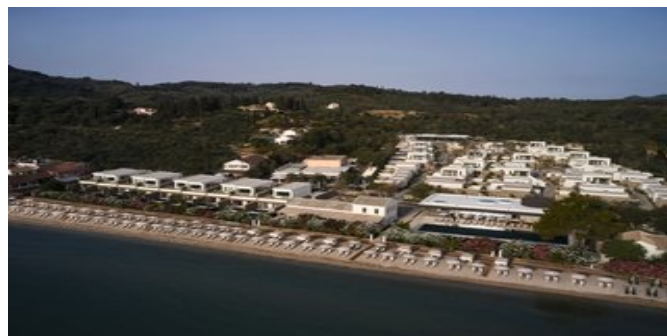
Blick auf den Strand und die Anlage

PREMIER SUITEN (UF) Ca. 66 qm. Für 2-3 Erwachsene oder 2 Erwachsenen und 1-2 Kinder. Grundausstattung wie die Junior Suiten. Wohn-/Schlafraum mit Sofa (Doppelbett) und ein