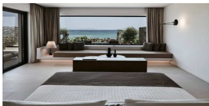
Wohnbeispiel Riviera Suiten