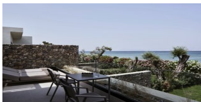
Auf dem Balkon einer Riviera Suite