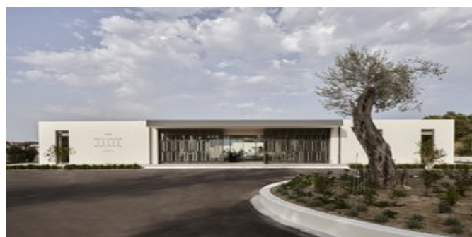
Das Hotel "The Olivar Suites"