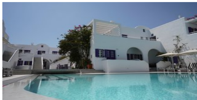
Das Hotel Kouros Village

SPARTIPP Bei Buchung eines Attika Mietwagens ab/bis Flughafen Transfergutschrift EUR 38 pro