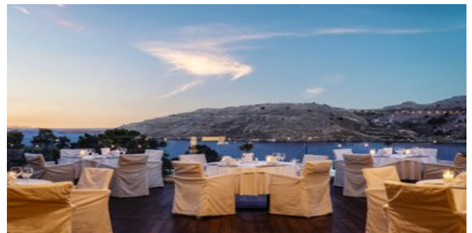
Mediterranean À-la-carte Restaurant "Thalatta"