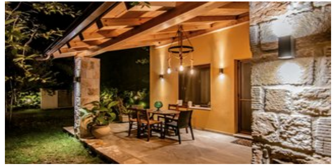
Terrasse des Wohnbereichs