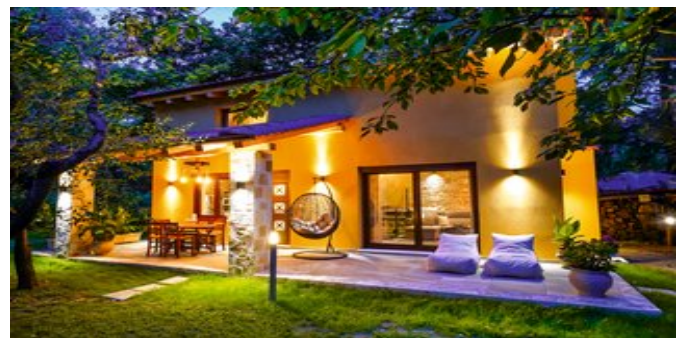
Außenansicht der Ferienanlage