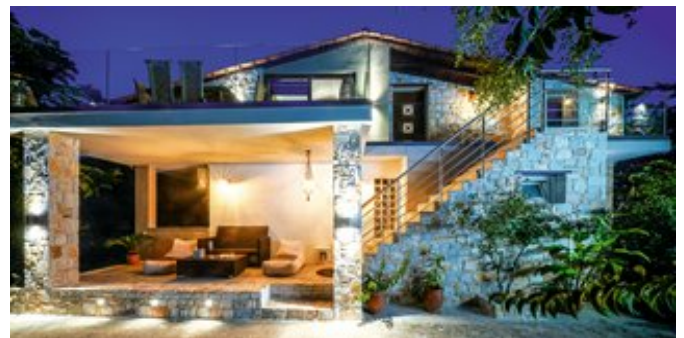
Außenansicht der Ferienanlage