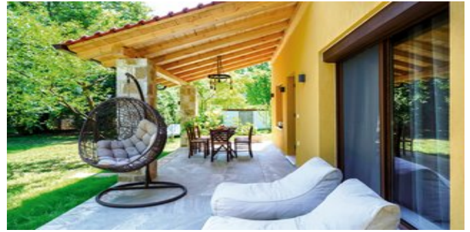
Terrasse mit Gartenanlage

JUNIORSUITEN (UA) Ca. 45 qm. Für 2-3 Erwachsene und 1 Kind. Neu renoviert. Grundausstattung wie die Deluxe Studios, jedoch mit gehobener Ausstattung und einem weiteren Satelliten-TV. Ein Doppelbett und eine großes Schlafsofa mit orthopädischer Matratze für die 3.