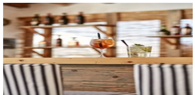
An der Bar