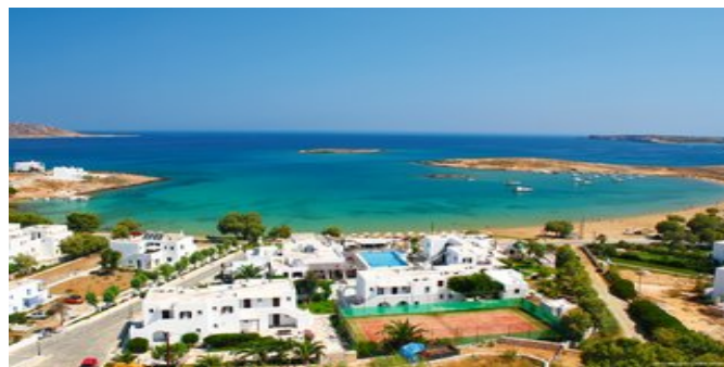
Blick auf das Contaratos Beach

SPARTIPP Bei Buchung eines Attika Mietwagens ab/bis Hafen Transfergutschrift EUR 34 pro Person. Einen Mietwagen der Kat. A1 erhalten Sie schon ab EUR 140 pro Woche.