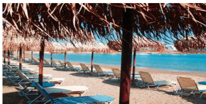
Der Strand bei der Anlage